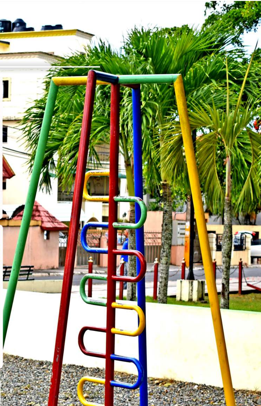
Area infantil del parque profesor Juan Bosch Urb. La Piña 2