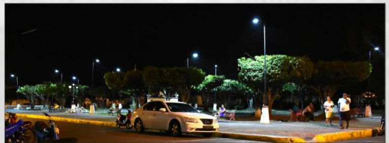
Iluminación del Parque Olegario