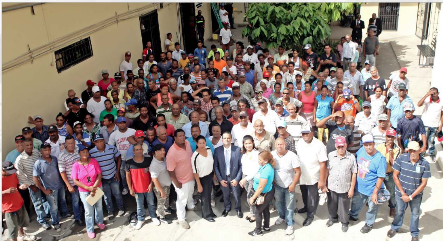
Equipo de Trabajo Dpto. de Ornato, Plazas y Parques.