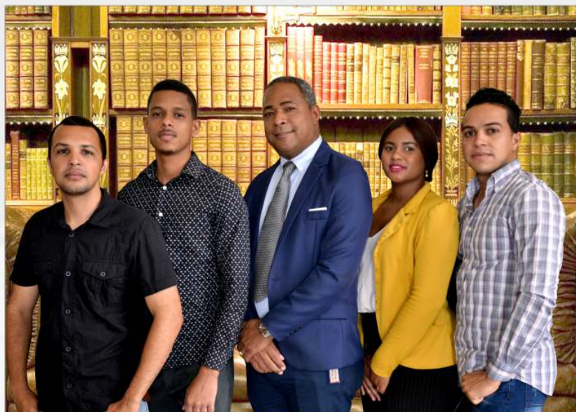
Dpto. Tecnología de la información