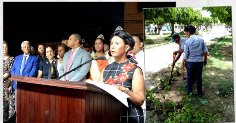
Acto de Reinauguración del Parque de los Mártires