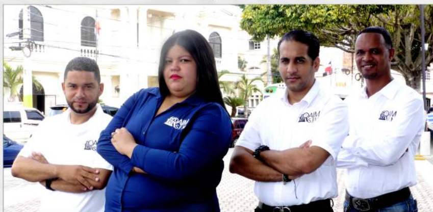
Dpto. Acceso a la Informacin Municipal