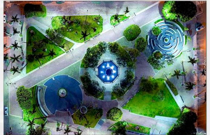
Remodelación y paisajismo del Parque Duarte de San Francisco de Macorís.