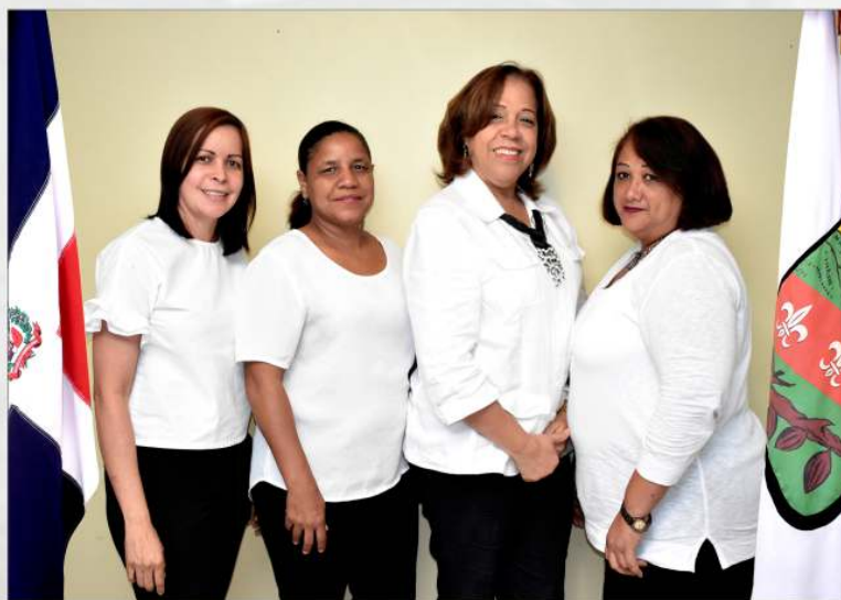
Departamento de Planificación