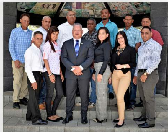
Dpto. De Tránsito